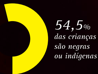
GRÁFICO 1 – NÚMERO DE CRIANÇAS E ADOLESCENTES INDÍGENAS E NEGROS NO PAÍS

No Brasil, vivem 31 milhões de meninas e meninos negros e 140 mil crianças indígenas. Eles representam 54,5% de todas as crianças e adolescentes brasileiros 1 .