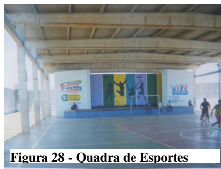
Figura 28 - Quadra de Esportes

O baba 21 também é afazer, é pra distrair a mente...pra não ficar com a mente apertada...tudo pra tirar nossa medida de boa 22 (Belo, 16 anos).