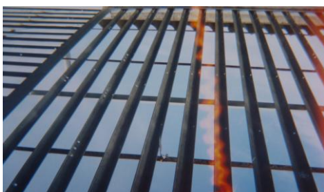
Figura 6 - Grade da parte superior do alojamento

A estrutura física, mesmo dentro de uma unidade construída após a promulgação do Estatuto, apresenta características inerentes ao sistema prisional. As celas, as grades, os muros e guaritas fazem parte da internação e foram significadas pelos adolescentes como condições importantes dentro da MSEI, como podemos perceber nas imagens e nos discursos a seguir: