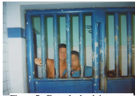
Figura 7 - Entrada do alojamento

Tem uma grade imensa na entrada e olhando por dentro tem vários chapões, várias grades...tem momentos que o adolescente acorda de um sonho bom...e se depara com quatro paredes e uma grade, é onde ele entra em desespero...significa dor e sofrimento (Dinho, 19 anos).