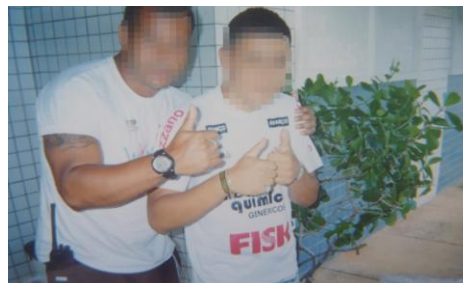
Figura 44 - Orientador e Adolescente