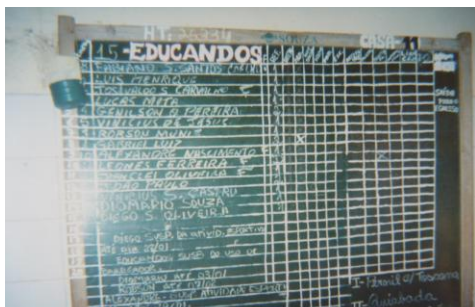
Figura 17 - Quadro de Educandos (disponível em cada casa)

Algumas imagens demonstraram, claramente, a organização necessária ao bom funcionamento da unidade, como o quadro de adolescentes e a ordenação dos espaços, explicadas pelas falas abaixo: