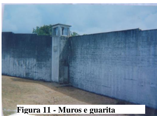
Figura 11 - Muros e guarita

De acordo com Arpini (2003), em pesquisa realizada com adolescentes em situação de risco, as instituições que os acolhem fazem com que se sintam protegidos da violência vivida, e estas passem a ser percebidas não mais com a “força negativa e destrutiva que marcava as instituições tradicionais” (p.176), mas, ao contrário, como espaços em que possam evidenciar vivências menos sofridas e traumáticas que as experiências extramuros. Esta realidade é corroborada pela fala a seguir: