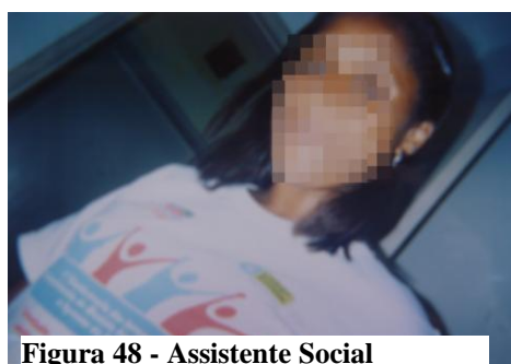
Figura 48 - Assistente Social

Os profissionais ficam falando pra gente não se envolver mais (Bibia, 17 anos).