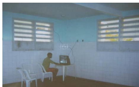
Figura 29 - Salão de TV (interior da casa)

Tem aqui um adolescente assistindo (TV). E ao mesmo tempo solidão, saudade da família. Às vezes assim, a gente pensa na nossa família e tem que distrair a mente com a televisão, com o que tem (Dinho, 19 anos).