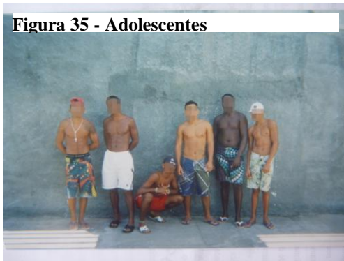
Figura 35 - Adolescentes

Aqui é os meninos da casa que eu convivo e a partir do momento que a gente tá vivendo junto...nós podemos dizer que aqui é nossa família aqui dentro...é um querendo o mesmo objetivo do outro, que é ir embora e sair de cabeça erguida (Bibia, 17 anos).