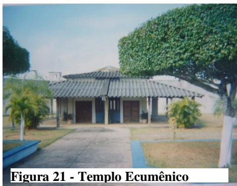
Figura 21 - Templo Ecumênico

O templo faz parte porque muitas vidas está sendo mudada e transformada aí...olhando com o olhar e o templo faz parte da nossa medida...(adolescente) que saiu com Deus está vivendo a vida lá fora, sem Deus ninguém é nada...não tinha conhecimento da palavra de Deus lá fora não (Belo, 16 anos).