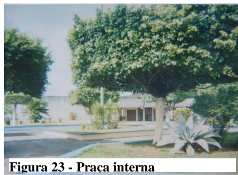
Figura 23 - Praça interna

O jardim que é a parte do lazer mais pra quando a família vem, sabe. Quando tem um evento...todo mundo gosta do jardim (Dinho, 19 anos).