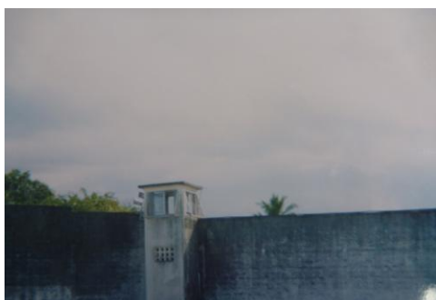
Figura 10 - Muros externos e guarita

Em unidades de internação, a disciplina é pautada no encarceramento. A segurança que olha tudo nos remete ao panoptismo, em que a vigilância sobre os indivíduos vai além do que ele faz, mas de quem ele é e do que pode fazer (Foucault, 1996/2002). De acordo com o autor, “a disciplina às vezes exige a cerca, a especificação de um local heterogêneo a todos os outros e fechado em si mesmo” (Foucault, 1996/2002, p.122). Os muros e guaritas surgem para criar este espaço disciplinar e de controle, conforme relatos dos adolescentes.