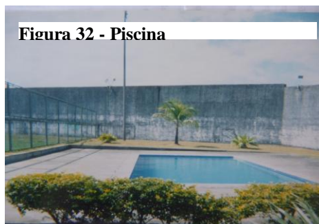
Figura 32 - Piscina

É a foto do campo de vôlei, aonde dá esse lazer pra gente também, a gente brinca, se diverte aqui, tira o lazer...aí o cara distrai a mente e não fica no veneno (Rafael, 17 anos).