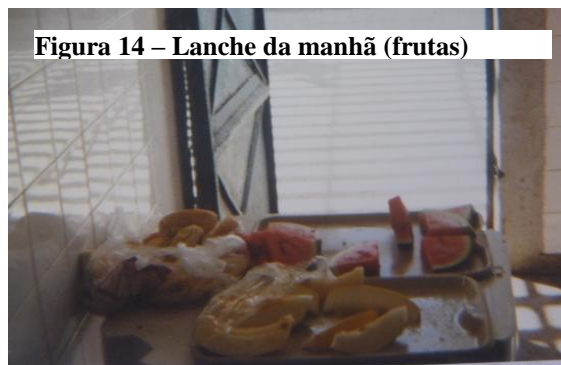
Figura 14 – Lanche da manhã (frutas)

A comida é importante porque senão nois vai morrer de fome...melancia é bom pra saúde...a gente tem 6 refeições no dia e passa pela nutricionista (Belo, 16 anos).