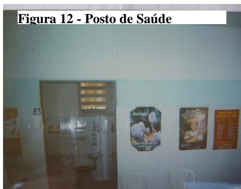
Figura 12 - Posto de Saúde

O Posto de Saúde ou P.S., como é chamado por todos que fazem parte da unidade, surgiu como parte importante da internação, pois significa cuidado e tratamento adequados, conforme as fotos e as falas dos próprios adolescentes.