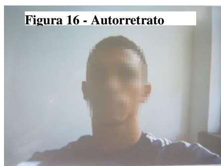
Figura 16 - Autorretrato

Os adolescentes demonstraram, através do autorretrato, o reconhecimento de sua responsabilidade para se atingir os objetivos da socioeducação, além de referirem mudanças já percebidas durante o cumprimento da medida socioeducativa de internação. Conforme aponta pesquisa de Yamamoto (2009), inicialmente os adolescentes têm dificuldades de compreender a instituição e seus objetivos, suas regras, mas, com o passar do tempo e a convivência dentro deste espaço, esta dificuldade diminui, como podemos perceber nas falas a seguir: