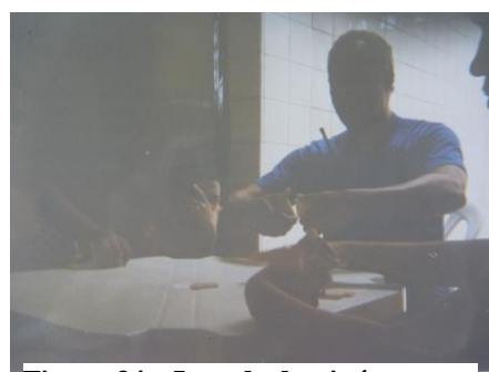
Figura 34 - Jogo de dominó entre orientadores e adolescentes

É no lazer, jogando dominó para distrair a mente e mostra o convívio um com o outro e com o monitor (Belo, 16 anos).