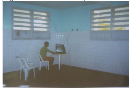
Figura 18 - Salão de TV (interior da casa)

As falas, a seguir, demonstram a existência de regras impostas pela unidade, em relação ao horário, e outras criadas pelos próprios adolescentes, com relação ao uso dos espaços e os momentos de solução de conflitos, em que o diálogo e o respeito são fatores significativos de convivência, reiterando a importância da participação dos adolescentes na elaboração de suas próprias regras. Enquanto momento de convivência e interações, o estabelecimento de regras pelos adolescentes tem um caráter regulador de comportamentos em prol de todo o grupo (J. O. Silva, 2009).