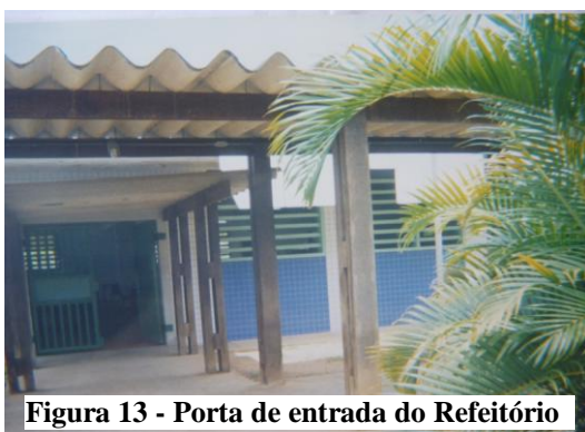
Figura 13 - Porta de entrada do Refeitório

A alimentação foi outro ponto significativo trazido por alguns dos adolescentes pesquisados, alimentação que em muitos casos está muito além do que o adolescente tinha acesso antes da internação. Algo que poderia passar despercebido aos que se debruçam sobre esta realidade e que faz parte dos significados dados à medida socioeducativa de internação, conforme imagens e relatos a seguir: