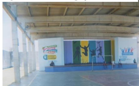
Figura 24 - Palco (espaço de eventos)

As unidades de internação devem possuir, segundo o SINASE (Brasil, 2012), espaços que possibilitem a realização da visita, de forma a promover a aproximação dos adolescentes com seus familiares, de forma que estes possam trocar afeto, conversar, sem se sentir inibidos ou limitados nesta troca.