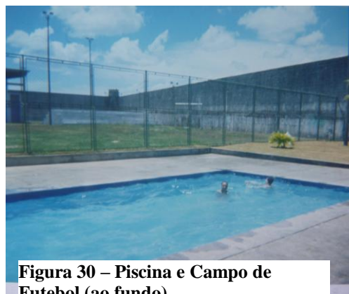
Figura 30 – Piscina e Campo de Futebol (ao fundo)