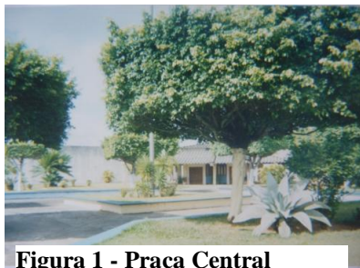
Figura 1 - Praça Central

Não é só que nem o povo pensa que é só cadeia..tem coisas boas também. A unidade é bonita, é um lugar saudável, não é como as pessoas ficam dizendo, que é um lugar feio, é bonito, tem muitas árvores (Xande, 16 anos).