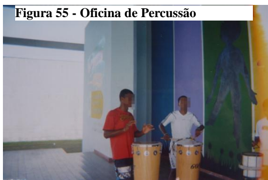
Figura 55 - Oficina de Percussão

Embora nem todas as oficinas disponibilizadas visassem, especificamente, a profissionalização, todas foram percebidas pelos adolescentes como possibilidades de inserção no mercado de trabalho, mesmo que informal, conforme nos apontam as falas a seguir: