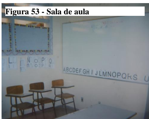
Figura 53 - Sala de aula

A escola é apresentada como obrigatória no cumprimento da medida socioeducativa de internação (Yamamoto, 2009). Muito embora seja obrigatória a matrícula do adolescente no momento de sua entrada na unidade, a participação deste na escola, com o comparecimento às aulas e às atividades escolares, não foi apontada, pelos profissionais desta unidade, como algo obrigatório, passível de sanções ao não ser cumprido. Ao contrário, o discurso que prevalece desde a figura do juiz até os profissionais que acompanham o adolescente, é que sua participação na vida escolar deve ser percebida como algo importante para sua vida fora dos muros da unidade. Embora o seu aproveitamento seja parte integrante do PIA e, portanto, dos relatórios emitidos, o peso dado a esta participação só terá relevância se esta estiver atrelada a um envolvimento real com a vida escolar, percebido pela construção de um projeto de vida que inclua a educação escolar. Esta ação busca evitar que os adolescentes frequentem a escola, durante a internação, por simples imposição da medida, em detrimento de uma possível vinculação real com a escola, que permaneça após sua saída da unidade. A escola precisa ser percebida como algo importante para a vida da pessoa, conforme relato abaixo: