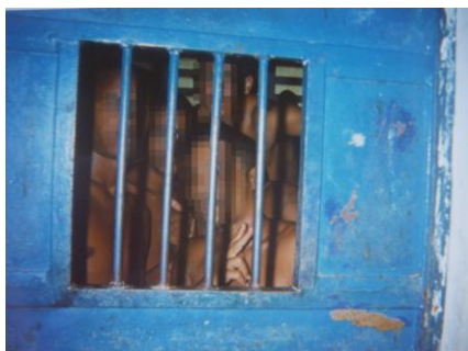
Figura 4 - Portão da Contenção

Embora as medidas socioeducativas tenham como principal foco a socioeducação e a responsabilização, e não a punição, este ideário punitivo perpassa os significados dados pelos sujeitos desta pesquisa à internação, que a percebem com as características de uma “prisão ou cadeia”, principalmente em relação à estrutura física. Conforme relatos que se seguem: