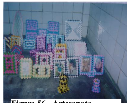
Figura 56 - Artesanato

A gente aprende um monte de coisa aqui, vim aprender aqui dentro um negócio deste (artesanato)...Isso aqui (artesanato) é um futuro, tem gente que vende isso aqui (Xande, 16anos).