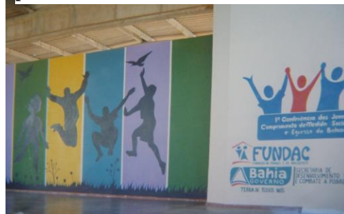
Figura 41- Pintura de palco elaborada para a Conferência