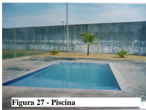
Figura 27 - Piscina

A parte da piscina faz parte do lazer...pra não ficar...encurralado dentro de casa (Belo, 16 anos).