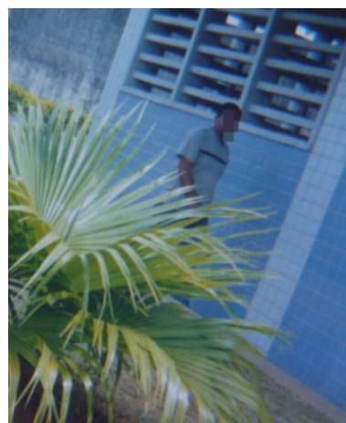
Figura 42 - Orientador de MSE

Aqui é o orientador que cuida da gente também, que vive o dia a dia com a gente (Mário, 18 anos).