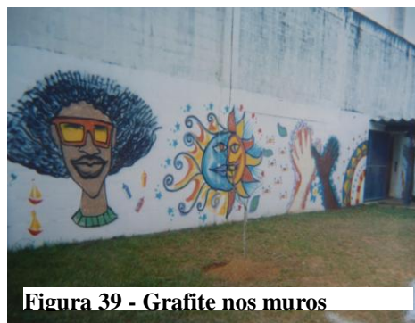
Figura 39 - Grafite nos muros

Aqui é do Carnaval...para poder comemorar ele...pra poder lembrar. Esta foto aqui eu tirei ela mostrando sobre a pintura que fizeram no Natal, fizeram aqui o desenho do boneco, o sol, as mãos, duas