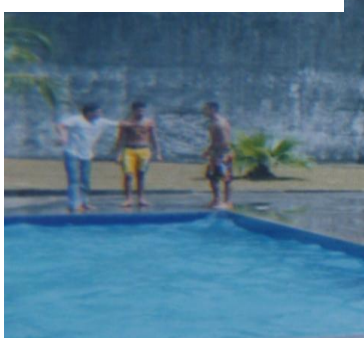
Figura 49 - Instrutor de esportes em atividade

Prof.M. (instrutor de esporte) ensina a gente também...é muito gente boa com a gente...trata a gente com respeito (Mário, 18 anos).