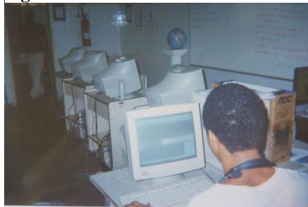
Figura 57 - Oficina de Informática