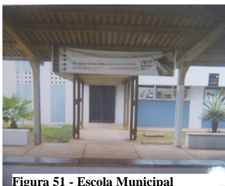
Figura 51 - Escola Municipal

Diante da imagem da escola, os adolescentes demonstraram que este espaço tem um significado importante em suas vidas, não apenas enquanto uma oportunidade de retomar os estudos, de aprender a ler e a escrever, mas, principalmente, como uma chance de pensar na manutenção do vínculo escolar após a liberação e na oportunidade de inserção no mercado de trabalho, conforme nos mostraram os relatos de todos os adolescentes, exemplificados pelo relato a seguir: