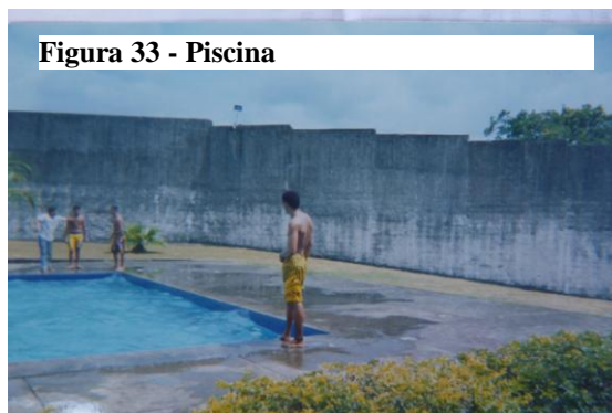
Figura 33 - Piscina

M. do vôlei (instrutor de esportes) chamou a gente pra participar e tudo, é uma coisa melhor também. Lá fora a gente não tem esta oportunidade, aqui dentro a gente tem esta oportunidade e tem que zelar. A piscina também, ele ensina a aula, a gente aprende a nadar... Esporte também, o professor ensina a