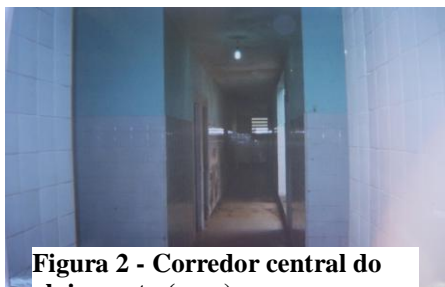
Figura 2 - Corredor central do alojamento (casa)

ficam abrigados, os adolescentes buscaram demonstrar uma realidade diferente da apontada pelos relatórios e conhecida da sociedade.