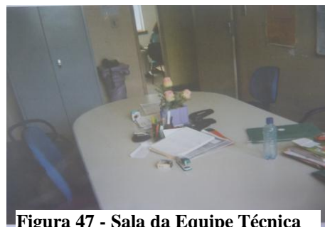
Figura 47 - Sala da Equipe Técnica

A maioria das nossas vidas está aqui com as assistentes, as coisas da nossa vida, eu tirei (a foto) por isso (Bibia, 17 anos).