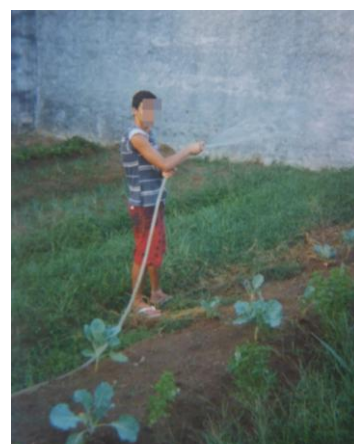
Figura 58 - Oficina de Agricultura