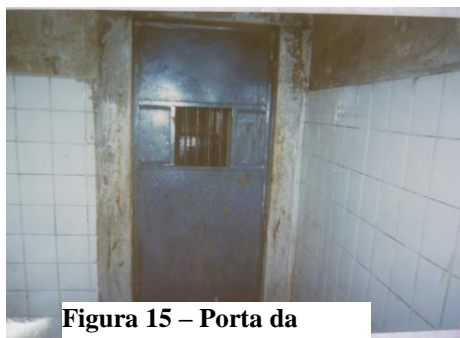
Figura 15 – Porta da Contenção

Estar privado de liberdade para estes adolescentes significa um momento de rever sua trajetória e repensar suas ações diante do mundo, visando melhorar estas ações em busca de um convívio social distante da vida infracional. As imagens que se apresentaram com o significado de punição, refletem também o discurso social, significando um “momento de reflexão”, conforme nos aponta a fala a seguir: