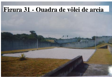
Figura 31 - Quadra de Vôlei

E aqui também tem a área de lazer que serve pra nós aliviar mais, a gente acaba esquecendo um pouco de a gente tá privado (Bibia, 17 anos).