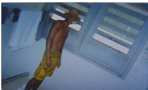
Figura 5 – Espaço interno da contenção

A transformação que se busca com o isolamento sistemático é a produção de um indivíduo que obedeça e que ao pensar, no confinamento solitário, passe a sentir-se vivendo em um vazio (F.C.S.Dias, 2007). Fato que ocorre também com as regras estabelecidas de horário de entrada e saída da contenção, quartos nos quais os adolescentes são “trancados”, que são percebidas pelos adolescentes pesquisados como naturais, conforme relato abaixo, já que fazem parte da vida diária, mascarando o caráter de controle disciplinar.