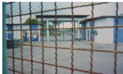
Figura 43 - Vista do Portão de Acesso

Quando a gente vai pra uma saída, passa por esse portão, que é o portão de entrada cá pra dentro...aí tem uns cara aqui fora...aí vem o monitor que toma conta do portão pra abrir e fechar (Rafael, 17 anos).