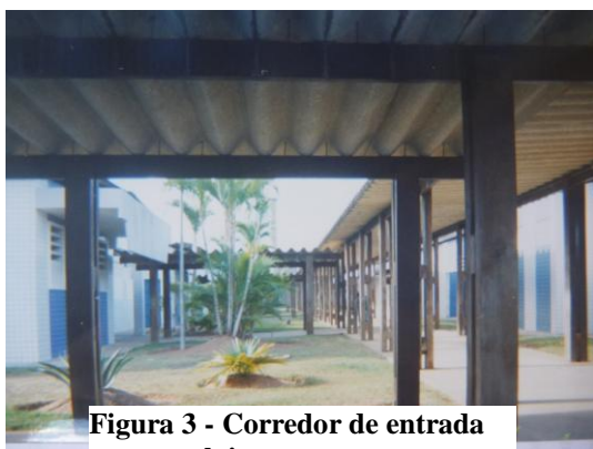
Figura 3 - Corredor de entrada para os alojamentos

Contudo, os adolescentes pesquisados percebiam que a unidade em que se encontravam apresentava-se como uma realidade distante da imagem que a sociedade tem de uma unidade socioeducativa, e do que foi relatado pela fiscalização, já que a unidade em questão apresentava, em suas dependências, amplos espaços físicos, tanto dentro dos alojamentos, chamados pelos adolescentes de casas, como em seus espaços comuns, que são arborizados e bem cuidados, além de oferecerem espaços de lazer que chamam a atenção de quem chega. Conforme nos relatou Dinho, que ao fotografar o corredor de entrada da unidade, quis mostrar que: