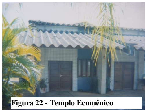
Figura 22 - Templo Ecumênico

Aqui é o templo, é a igreja de dia de domingo...pra gente falar da palavra de Deus, que é uma coisa importante também...vai ter um significado bom, pra mostrar que tirando a medida socioeducativa tem uma igreja, já é pra nós pensar mais, participar, saber da vida certa, do que vai querer...fala das coisas de Deus, e coisas de Deus é boa (Rafael, 17 anos).