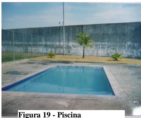
Figura 19 - Piscina

Aqui (piscina), sexta e sábado nós toma banho...fica uma hora...nós fica trancado das 10 horas até noutro dia as seis horas da manhã...toda sexta mesmo eu tô conversando com minha mãe (dia de ligação) (Rafael, 17 anos).