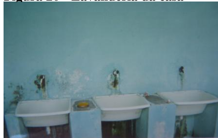
Figura 20 - Lavanderia da casa

Outras pesquisas, realizadas junto a adolescentes internos de instituições, confirmam este comparativo entre as regras da instituição e as da vida fora dela, referindo-se ao fato de não terem que cumprir tantas regras quando estão “soltos” e de haver muitas regras a serem cumpridas dentro da unidade, algumas que contrariam os desejos do adolescente e o que foi vivenciado pelo interno antes da privação (Brioli, 2009; Castro, 2006; M. H. Rocha, 2011; L.H.A.da Silva, 2007).