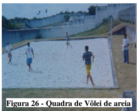
Figura 26 - Quadra de Vôlei de areia

O lazer nas unidades de privação de liberdade é visto pela sociedade, e por alguns profissionais que atuam nestas instituições, como um benefício ao qual o adolescente não tem direito, em virtude dos atos cometidos. Contudo, o lazer foi fotografado por todos os adolescentes pesquisados e as imagens que envolvem jogos, piscina e atividades esportivas e lúdicas, tiveram para estes adolescentes o significado de distração, de brincadeira e, principalmente, de alívio diante do sofrimento de estar longe da família e de estar privado de liberdade, fatores, considerados por eles, como importantes para um bom desenvolvimento no cumprimento da MSEI, conforme apontam os relatos a seguir: