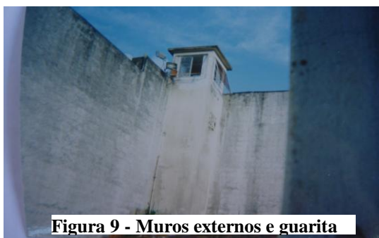
Figura 9 - Muros externos e guarita

O muro pra nós não fugi, se não tivesse o muro eu não fugia não, podia ser tudo aberto aí, que eu não fugia não, podia ter uma cerquinha, que eu não fugia (Belo, 16 anos).