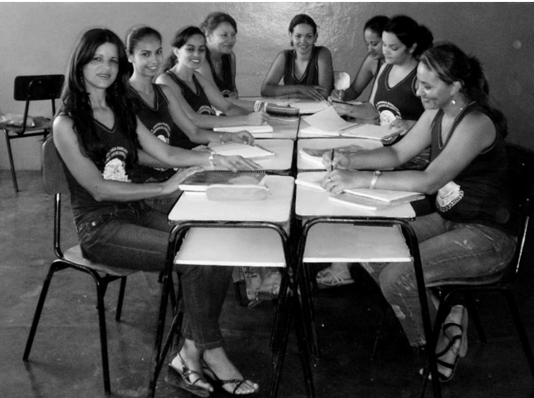
Reunião de planejamento na Escola Municipal Carlos Drummond de Andrade, em Mortugaba (BA)

Essa atividade deve ser feita na escola, pelos docentes e com a assessoria do coordenador pedagógico. E os horários definidos conforme a disponibilidade dos educadores. Mas como nem sempre é possível reunir toda a equipe durante a semana, algumas escolas organizam pelo menos um encontro mensal aos sábados. Professores com mais de um emprego, às vezes, não têm disponibilidade para participar das reuniões e acabam realizando o planejamento em casa.