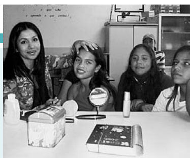
Oficina que trabalhou a auto-estima na Escola Municipal Bela União, em Horizontina (RS)

As melhorias de infra-estrutura da rede são orientadas pelo Planejamento de Desenvolvimento Institucional (PDI), documento surgido a partir do Plano Municipal de Educação, que tem como missão garantir as condições necessárias para a aprendizagem. É meta