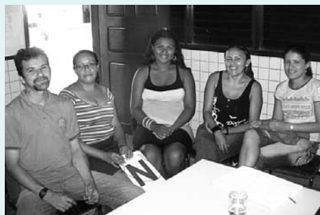
Professores da Unidade Integrada (UI) Professora Anna Maria Patello Saldanha, em Alto Alegre do Pindaré (MA)

Antes havia certa rejeição, os supervisores eram vistos como fiscais. Hoje o apoio dado por esses técnicos da secretaria ao bom desenvolvimento da prática pedagógica, por meio do acompanhamento e da colaboração na construção do planejamento, é muito valorizado e apontado como um dos fatores de superação das dificuldades em sala de aula.