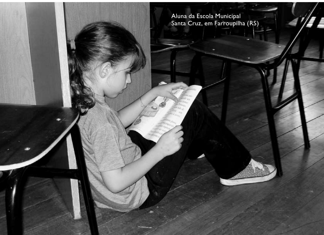
Aluna da Escola Municipal Santa Cruz, em Farroupilha (RS)

A iniciativa talvez mais inusitada de biblioteca itinerante vem de Alto Alegre do Pindaré (MA), onde uma equipe formada por estudantes, educadores e gestores conduz um jegue carregado de livros pela comunidade, promovendo rodas de leitura. Nas escolas que não possuem