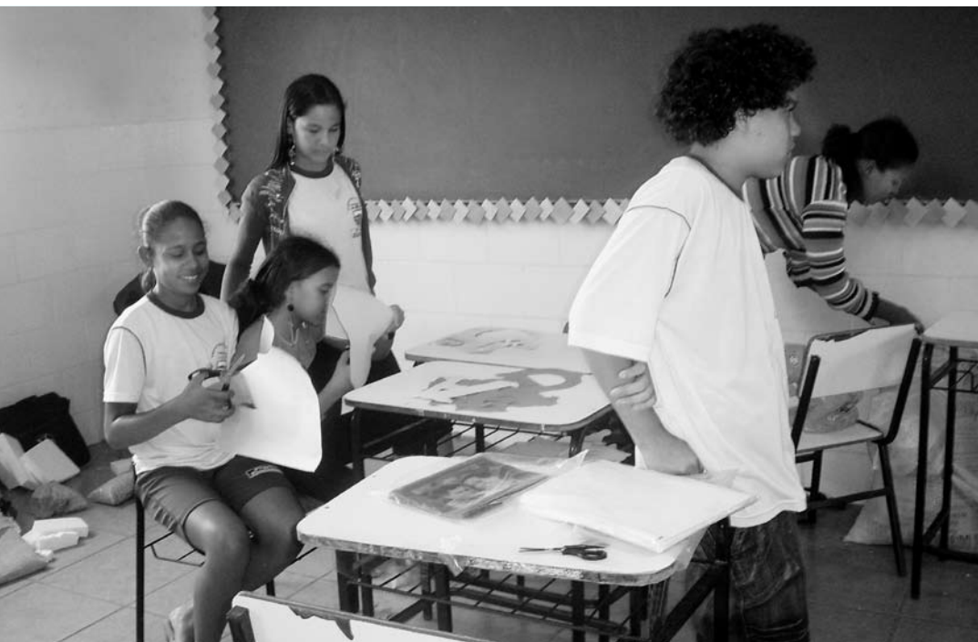
Alunos da Escola Municipal Izaíra Machado de Freitas Camargo preparam a Feira Cultural, em Formosa (GO)

Em Sapiranga (RS), o programa Lazer, Esporte e Cidadania se espalha pela cidade. São oferecidos atletismo, futsal, handebol, tênis, futebol, capoeira e xadrez em diversos es-