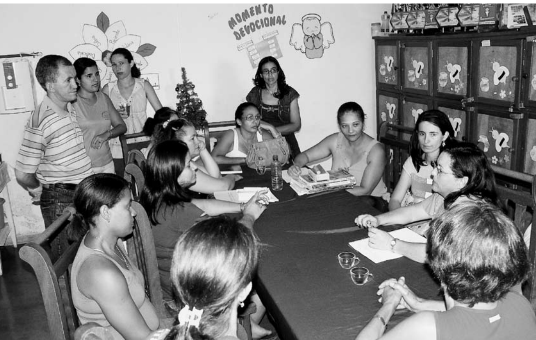
Professores da Escola Municipal Gercina Teixeira, em Piranhas (GO)

De modo geral, para as crianças das redes visitadas, os professores de suas escolas também têm alegria e disposição e sabem se aproximar. Essa característica foi destacada por alunos de Horizontina (RS). “O professor vem com alegria e disposição. E isso ajuda os alunos”, diz um deles. Em Arroio do Meio (RS), a proximidade traz confiança: “Se tu não tens nenhum amigo, no professor tu podes confiar”, diz uma aluna da rede.