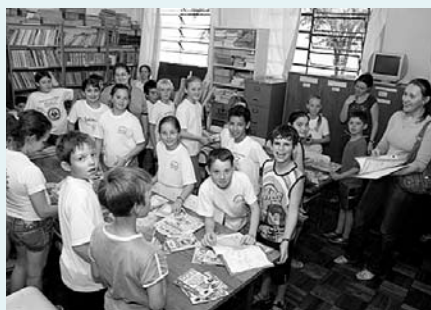
Alunos da Escola Municipal Modesto de Palma, em Realeza (PR)

A secretaria também tem uma política de motivação e elevação da auto-estima dos professores. Nas palavras da dirigente, “da parte pedagógica a gente cuida, mas o mais difícil é cuidar da alma das criaturas”. E, para cuidar da “alma”, a equipe da secretaria