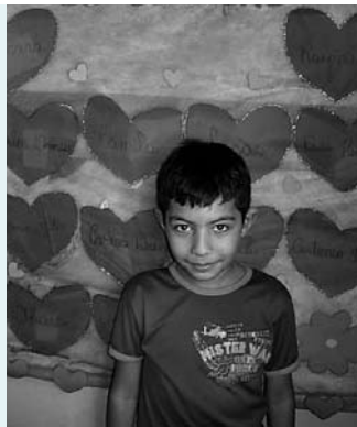
Aluno da Escola Municipal N.P.A., de Araguaína (TO)

A Secretaria de Educação de Araguaína (TO) criou uma superintendência para acompanhar a formação dos professores e a aprendizagem dos alunos. Os membros da equipe foram selecionados entre os profissionais que mais se destacaram em programas do MEC para formação em Matemática e Português e têm como missão apoiar as escolas e os professores na elaboração do projeto pedagógico, no planejamento das aulas e na definição de estratégias contra a evasão escolar. “O superintendente vem pelo menos três vezes por semana à escola, para trabalhar com os professores e a coordenação pedagógica. Ele é o formador, que traz